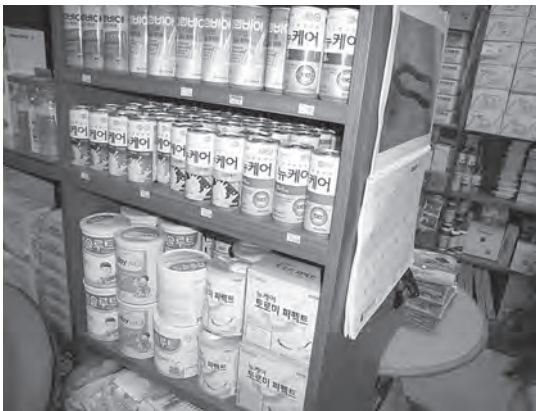
ソウル大学病院売店にて (下段右がとろみ調整食品。上段は流動食)

我々は、これまでに例のない超高齢社会をいち早く経験し、試行錯誤を行いながら種々の問題に取り組んでいるところです。そんな中、日本の介護食品の考え方は先駆的な取り組みであり、ユニバーサルデザインフードの仕組みづくりは特筆するものでしょう。しかし、この新たな局面には「お手本」がなかった故、必然的に多くの考え方が発生・存在し、一方では混沌とした面があるこ